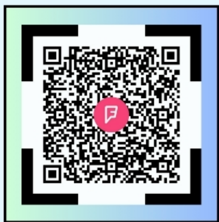
กฎหมายที่เกี่ยวข้อง