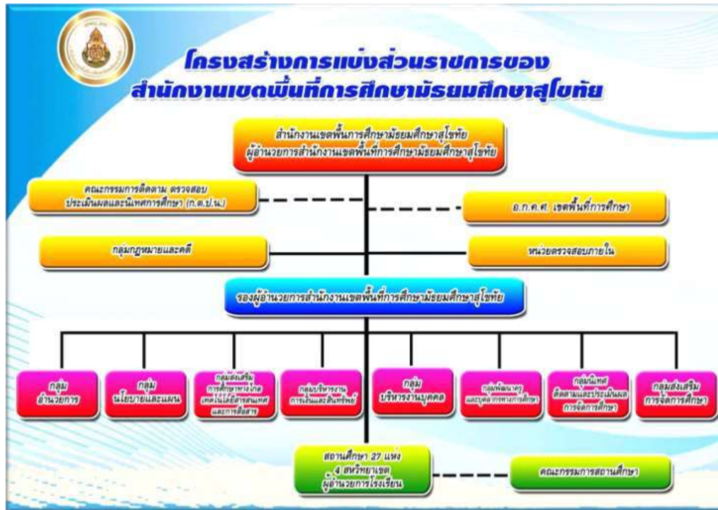
สำนักงานเขตพื้นที่การศึกษามัธยมศึกษาสุโขทัย